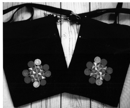
ภาพ 3 : ผลิตภัณฑ์ผ้าทอร่วมสมัยบางส่วนที่ผ่านการพิจารณาจากผู้ทรงคุณวุฒิ