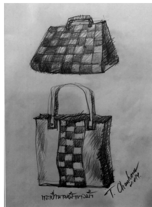
ภาพ 2 : ต้นแบบผลิตภัณฑ์ที่เกิดจากการมีส่วนร่วมของคนในชุมชน