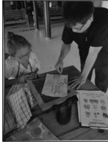
ภาพ 1 : การออกแบบผลิตภัณฑ์ผ้าทอร่วมกันกับชาวชุมชนไทยทรงดำ