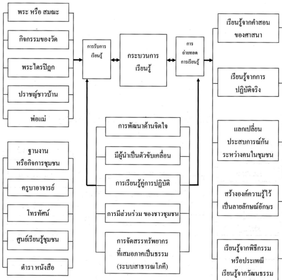
ภาพ 1 รูปแบบองค์ความรู้และภูมิปัญญาท้องถิ่นของชุมชนราชธานีอโศก