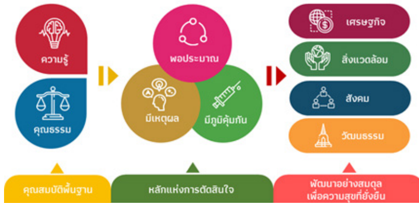
ภาพ 4 ปรัชญาเศรษฐกิจพอเพียงกับการพัฒนาอย่างยั่งยืน

ปรัชญาเศรษฐกิจพอเพียงและเป้าหมายการพัฒนาอย่างยั่งยืนได้มีการบูรณาการไว้ในกรอบยุทธศาสตร์ชาติ รวมถึงแผนพัฒนาเศรษฐกิจและสังคมแห่งชาติฉบับที่ 12 (พ.ศ. 2560-2564) และนโยบายประเทศไทย 4.0 ทั้งนี้ ภายใต้รัฐธรรมนูญแห่งราชอาณาจักรไทย ประเทศไทยได้ประกาศยุทธศาสตร์ชาติขึ้น เพื่อให้เป็นเป้าหมายในการพัฒนาประเทศอย่างยั่งยืนตามหลักธรรมาภิบาล และเพื่อใช้เป็นกรอบในการจัดทำแผนต่าง ๆ ให้สอดคล้องและบูรณาการกัน อันจะนำไปสู่เป้าหมายได้ตามกำหนดเวลาที่ระบุไว้ในยุทธศาสตร์ชาติ 20 ปี (พ.ศ. 2561 – 2580) พร้อมกับอันจะนำไปสู่การปฏิบัติเพื่อให้ประเทศไทยบรรลุวิสัยทัศน์ “ประเทศไทยมีความมั่นคง มั่งคั่ง ยั่งยืน เป็นประเทศพัฒนาแล้ว ด้วยการพัฒนาตามหลักปรัชญาของเศรษฐกิจพอเพียง” ได้ในที่สุด (สำนักงานสภาพัฒนาการเศรษฐกิจและสังคมแห่งชาติ, 2560)