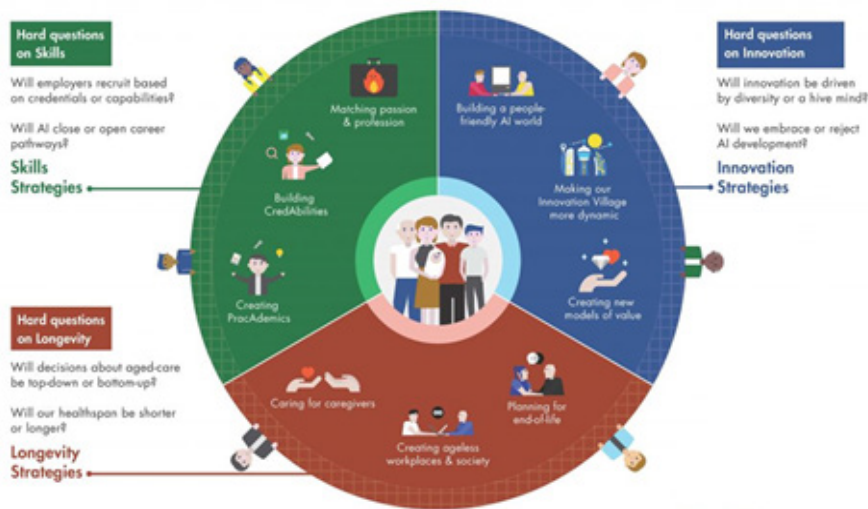
ภาพ 6 นโยบายการสร้างประเทศให้มีความแตกต่าง (Doing Singapore Differently) ของสิงคโปร์

ในขณะเดียวกัน สิงคโปร์ยังได้กำหนดนโยบายที่เรียกว่า “สร้างประเทศให้มีความแตกต่าง (Doing Singapore Differently)” ภายในปี พ.ศ. 2569 (ค.ศ. 2026) โดยการให้พลเมืองของประเทศเป็นศูนย์กลางของการพัฒนาแนวคิดที่ก่อให้เกิดนโยบายนี้ กำเนิดจากการที่การพัฒนาเทคโนโลยีมีความก้าวหน้าอย่างมากจนทำให้เกิดการหยุดชะงักของระบบสังคม (Societal disruption) รัฐจึงเกิดแนวคิดที่ว่า ประเทศควรจะต้องทำอย่างไรจึงจะทำให้พลเมืองสามารถช่วยเหลือซึ่งกันและกัน เพื่อให้เกิดความเป็นดีอยู่ดีและมีความสุขมากขึ้น ซึ่งในแผนปฏิบัติการของนโยบายนี้ จะมุ่งเน้นการพัฒนาทรัพยากรมนุษย์ใน 3 ยุทธศาสตร์ ประกอบด้วย ยุทธศาสตร์การเพิ่มทักษะ ยุทธศาสตร์การประยุกต์ใช้นวัตกรรม และยุทธศาสตร์การมีชีวิตที่ยืนยาว ดังแสดงในภาพที่ 6