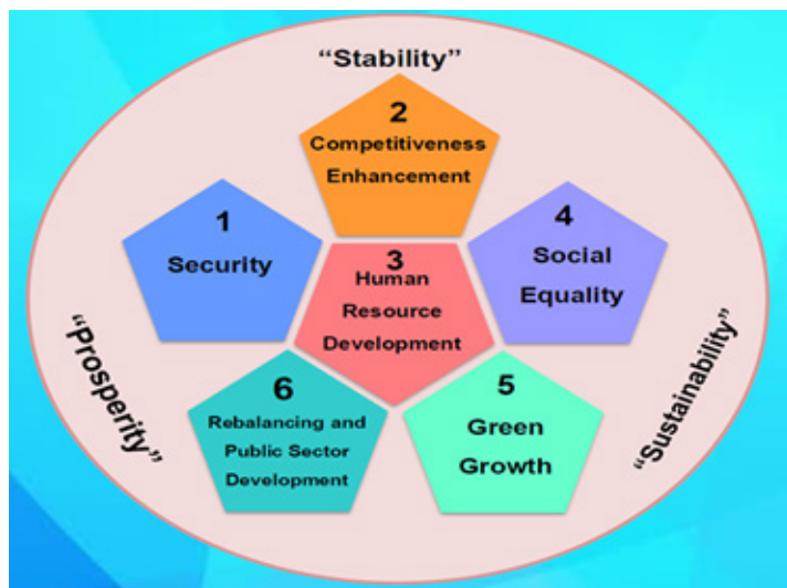
ภาพ 5 ยุทธศาสตร์หลักในกรอบยุทธศาสตร์ชาติของไทยระยะเวลา 20 ปี (พ.ศ. 2561 – 2580) ที่มา: สำนักงานสภาพัฒนาการเศรษฐกิจและสังคมแห่งชาติ (2560)

โดยในแผนยุทธศาสตร์ชาติฉบับดังกล่าว (สำนักงานสภาพัฒนาการเศรษฐกิจและสังคมแห่งชาติ, 2560) ระบุเป้าหมายของการพัฒนาว่า “ยุทธศาสตร์หลักในการพัฒนาทั้ง 6 ด้าน (ตามภาพที่ 5) มีเป้าหมายเพื่อเพิ่มและพัฒนาศักยภาพของทุนมนุษย์ ให้ความยุติธรรมและลดความเหลื่อมล้ำทางสังคม เสริมสร้างความแข็งแกร่งทางเศรษฐกิจและเพิ่มขีดความสามารถในการแข่งขันอย่างยั่งยืน ส่งเสริมการเติบโตที่เป็นมิตรต่อสิ่งแวดล้อมเพื่อการพัฒนาอย่างยั่งยืน เสริมสร้างเสถียรภาพของชาติเพื่อการพัฒนาประเทศสู่ความมั่งคั่งและความยั่งยืน และเพิ่มประสิทธิภาพในการบริหารจัดการภาครัฐและส่งเสริมธรรมาภิบาล”