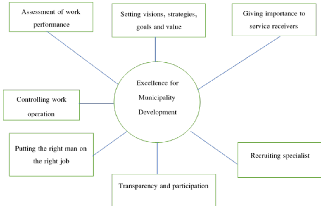
Figure 1: New Knowledge Derived from the Research